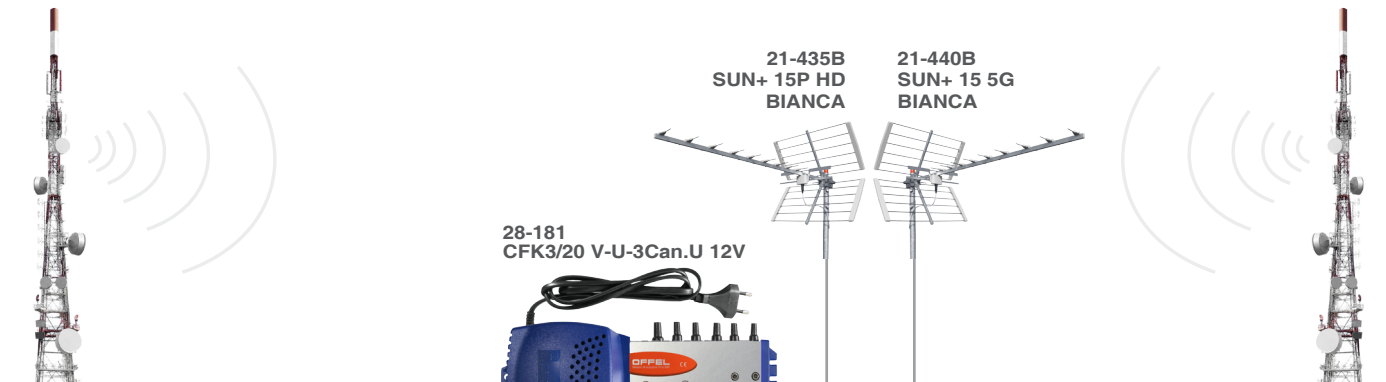
Antenne trasmettenti direzione A