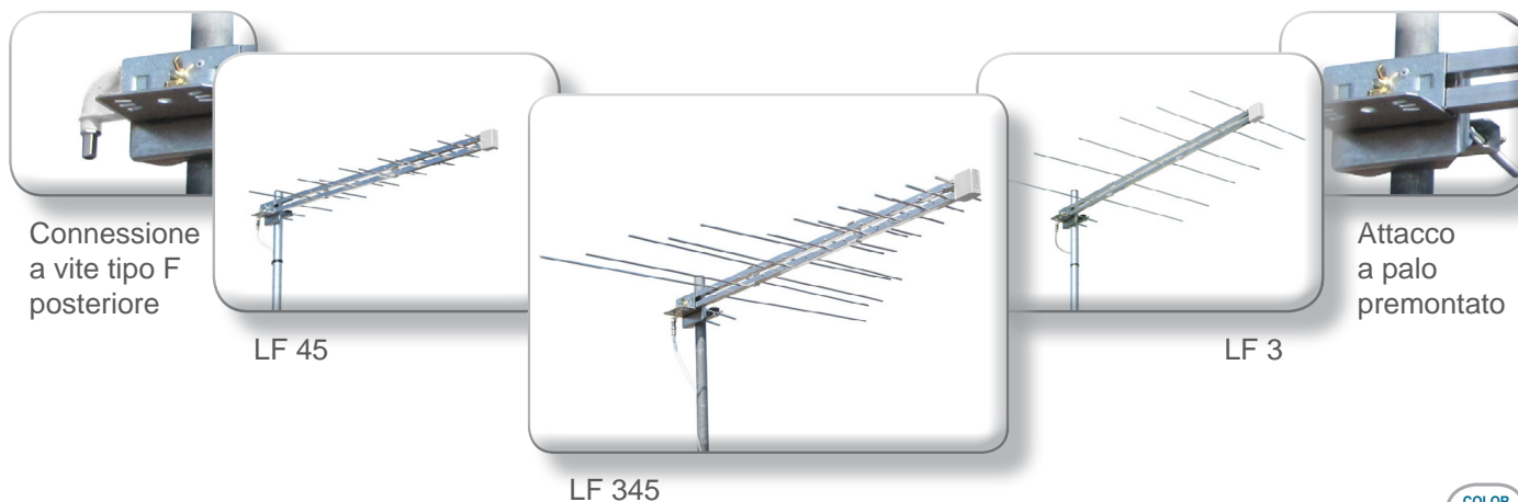
Connessione a vite tipo F posteriore