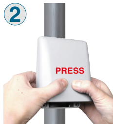
2 Premere sul coperchio per aprirlo.