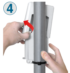
4 Sfilare il coperchio dalla guida inclinandolo da un lato.