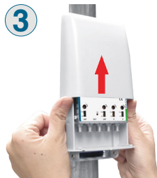
3 Sollevare il coperchio fino alla sommità della guida.