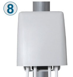
8 Effettuate le opportune regolazioni, richiudere il coperchio.