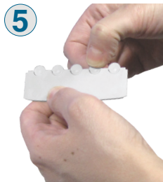
5 Sfilare il frontalino e rimuovere i fori pretagliati in corrispondenza dei connettori a cui verranno collegati i cavi.