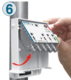
6 Ruotare la meccanica in pressofusione grazie al meccanismo basculante.