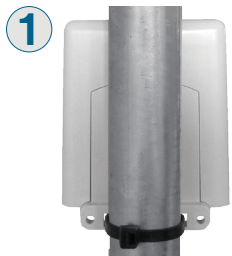
1 Fissare il centralino al palo mediante l'apposito accessorio.