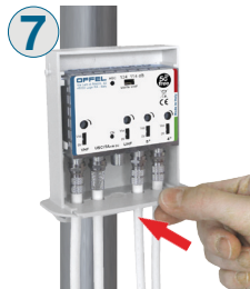
7 Dopo aver collegato i cavi, riportare la meccanica nella posizione iniziale e reinserire il frontalino inferiore.