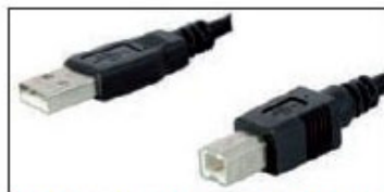
Cavo USB (per la connessione al PC)