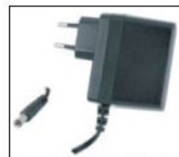
Alimentatore +5V / 4A