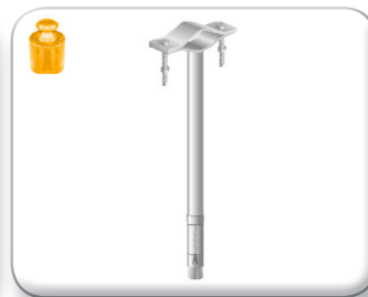
Zanca espansione 45 cm tondino pieno

Cavallotto 30x4 mm Palo Ø 30÷60 mm Viti 8x60 mm