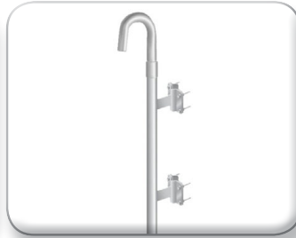
Palo curvo distanziato