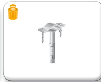
Zanca espansione 5 cm tondino pieno

Cavallotto 30x4 mm Palo Ø 30÷60 mm Viti 8x60 mm