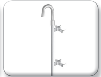
Palo curvo distanziato rinforzato

Ø 50 mm, Spess. 2 mm Con staffa antirotazione