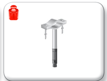
Zanca espansione rinforzata

Cavallotto 30x4 mm Palo Ø 30÷60 mm Viti 8x60 mm