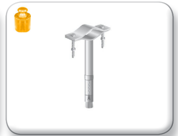
Zanca espansione 10 cm tondino pieno

Cavallotto 30x4 mm Palo Ø 30÷60 mm Viti 8x60 mm