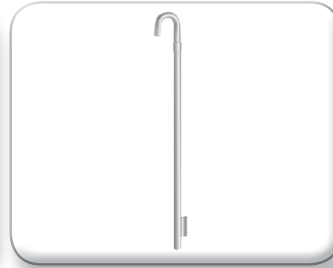
Palo curvo con staffa antirotazione