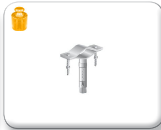
Zanca espansione pari muro tondino pieno