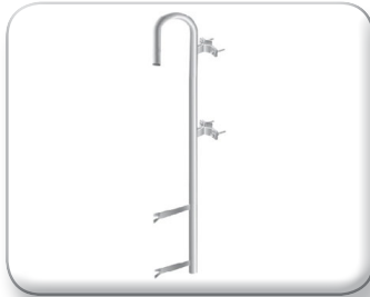
Palo curvo con zanca a murare

Ø 50 mm, Spess. 2 mm Dist. 50 mm rinforzato