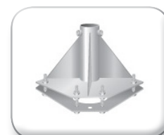
Base per traliccio con cerniera ribaltabile