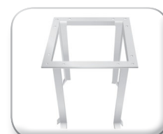
Telaio da murare quadrato