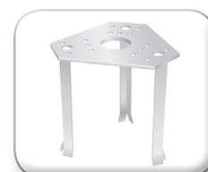
Base da murare triangolare