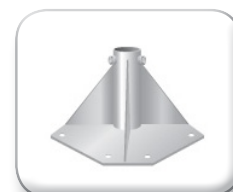
Base per traliccio piastra triangolare