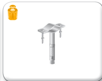
Zanca espansione 5 cm tondino pieno