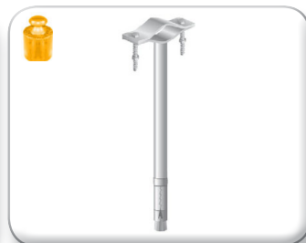
Zanca espansione 45 cm tondino pieno