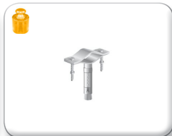
Zanca espansione pari muro tondino pieno