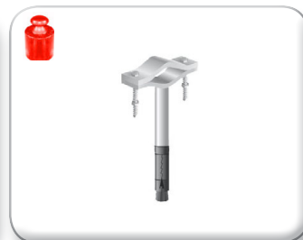
Zanca espansione rinforzata