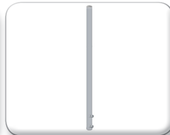
Palo per zanca di fissaggio sottotetto