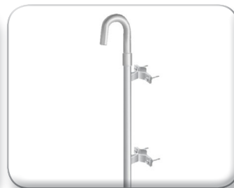
Palo curvo distanziato rinforzato