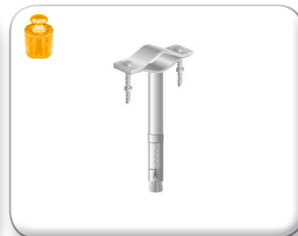
Zanca espansione 10 cm tondino pieno