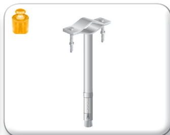
Zanca espansione 25 cm tondino pieno