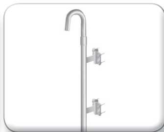
Palo curvo distanziato