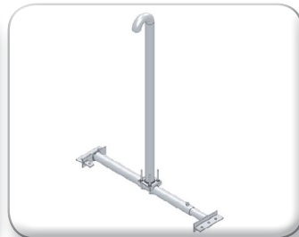
Zanca di fissaggio sottotetto