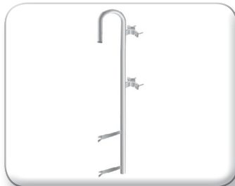
Palo curvo con zanca a murare