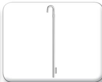
Palo curvo con staffa antirotazione